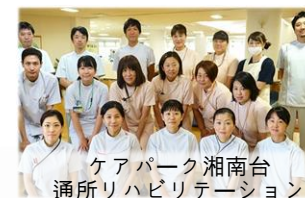
ケアパーク湘南台 通所リハビリテーション