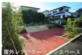
屋外レクリエーションスペース

付帯設備 ・バリアフリー設計(手すり・段差フリー) ・個浴室x2室、機械浴室1室 ・車椅子トイレ ・各居室内：電動介護ベッド、エアコン、洗面台、クローゼット、ナースコール、カーテン、 ベッドサイドテーブル、床頭台