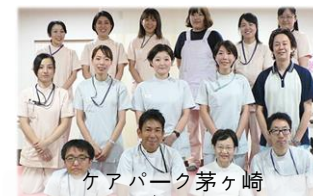
ケアパーク茅ヶ崎 通所リハビリテーション

ケアパーク湘南台・ケアパーク茅ヶ崎の通所リハビリをご利用いただけます。ケアパークヴィラまで送迎車でお待ちしております。